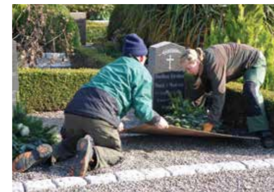
Fra grandækningskursus.

Gravere i provstiet samt personalet på Nykøbing kirkegård mødes jævnligt og afholder også kurser, planlagt af gruppen og betalt af menighedsrådene. I uge 42 handlede kurset om grandækning. I et referat fra dagen (som sendes til alle involverede menighedsråd) står der: