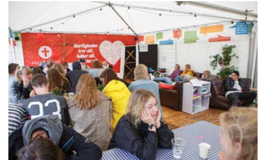
Kirketeltet på Nibefestivalen.

nene og den anden halvdel forvaltes af stifternes fælles kapitalforvaltning.