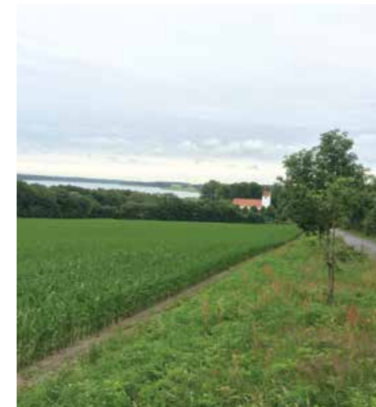
Kirken på landet ligger idyllisk, men der er også udfordringer. Sebber kirke, Nibe bredning

Gevinsterne ved at være kirke på landet overskygger således i høj grad udfordringerne. Man må derfor håbe, at der også fremover vil være kirker og præster på landet.