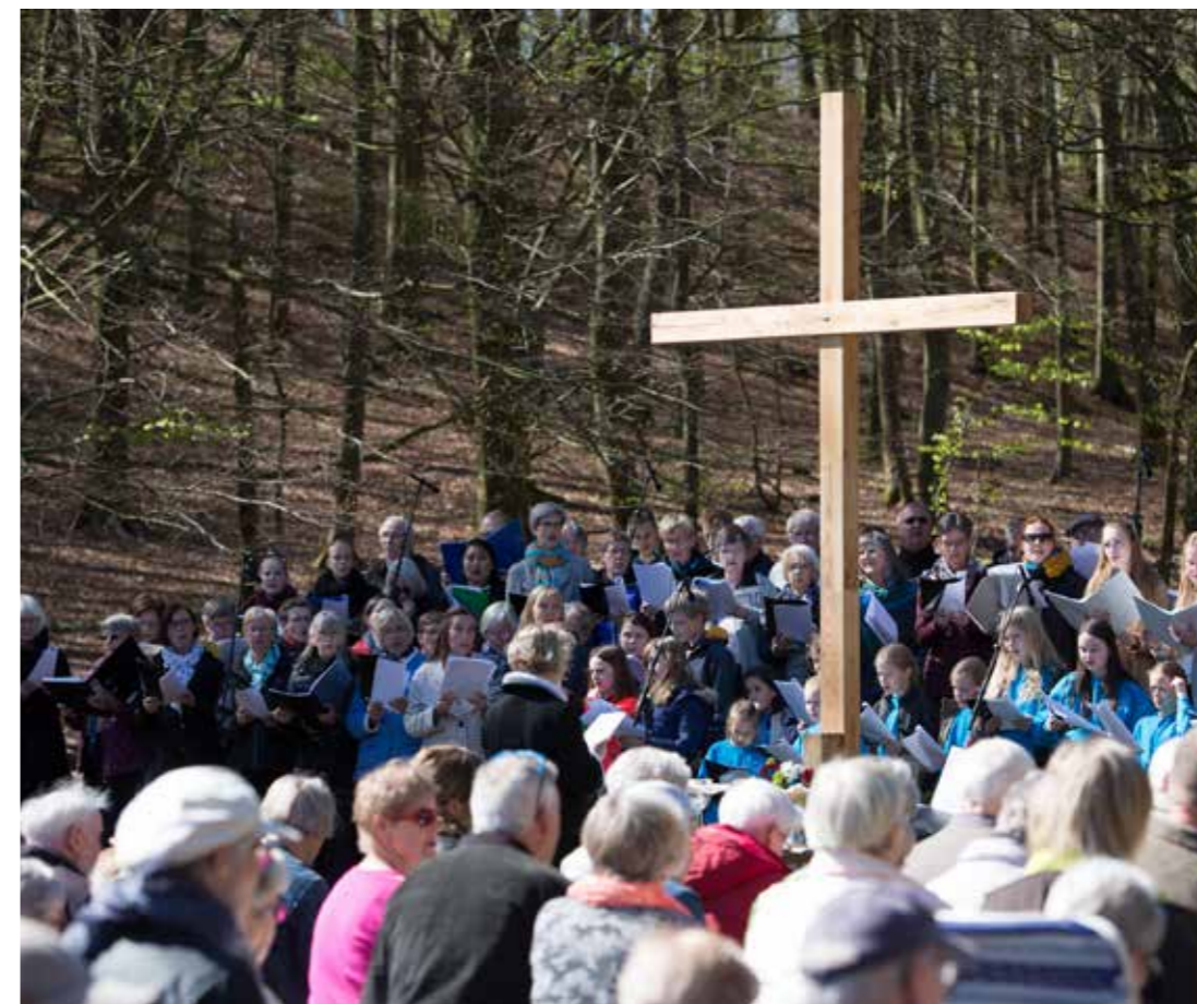
250 kirkegængere og 100 deltagere (kor, musikere og sangere) var torsdag den 5. maj 2016 samlet til friluftsgudstjeneste i Lundby Bakker.

De enkelte workshops bærer præg af ”pit-stops” fra dagligdagen, hvor præsterne gennem dialog og refleksion i fællesskab vil lægge sporene ud for en fælles retning og samarbejdsstruktur, hvor præsterne betragtes som en samlet gruppe med provsten som leder.