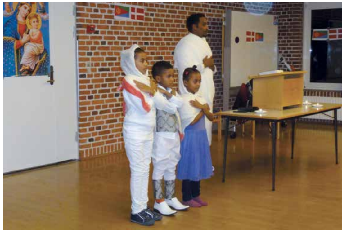
Et mini micro børnekor fra Eritrea. Med kraftige og meget tydelige stemmer.

Efter sommerferien bliver undervisningen suppleret med små praktikforløb i forskellige menigheder i provstiet og en weekendlejr. Den første søndag i advent bliver de indsat som færdiguddannede Kirkens Ungdoms Ledere ved gudstjenesten, hvor de også selv medvirker.