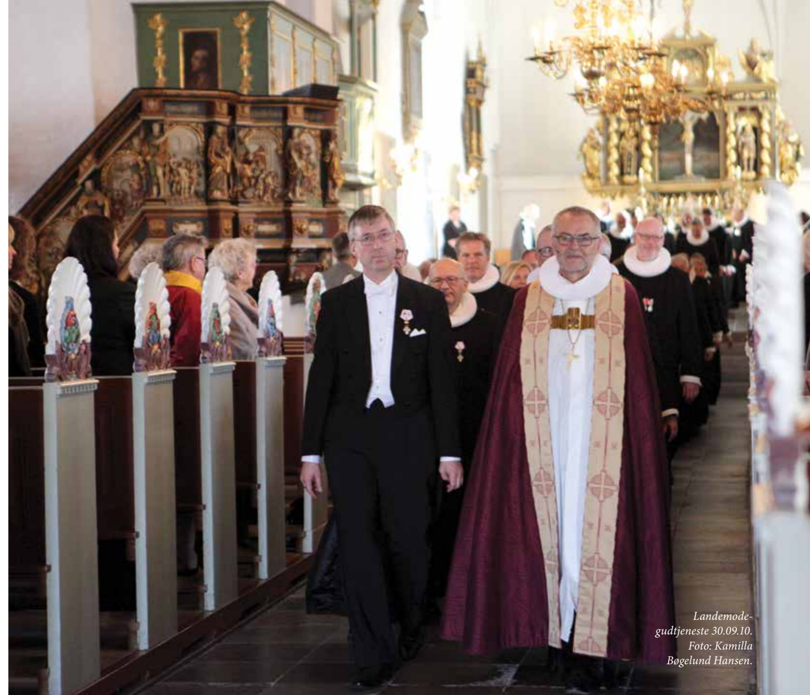
Landemode- gudtjeneste 30.09.10.

Med det nye stiftsudvalg får vi mulighed for at netværke og samle erfaringer på en ny måde. Vi får mulighed for at koordinere indsatsen, så de præster og menigheder der arbejder med området kan finde sammen i en fælles erfaringsudvikling og med udvalget får man et sted at henvende sig,