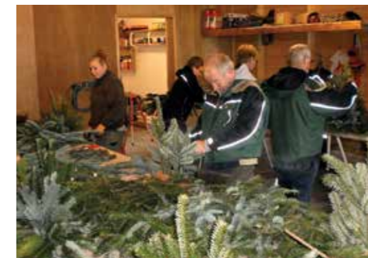
Grandækning Nykøbing Mors Kirkegård.