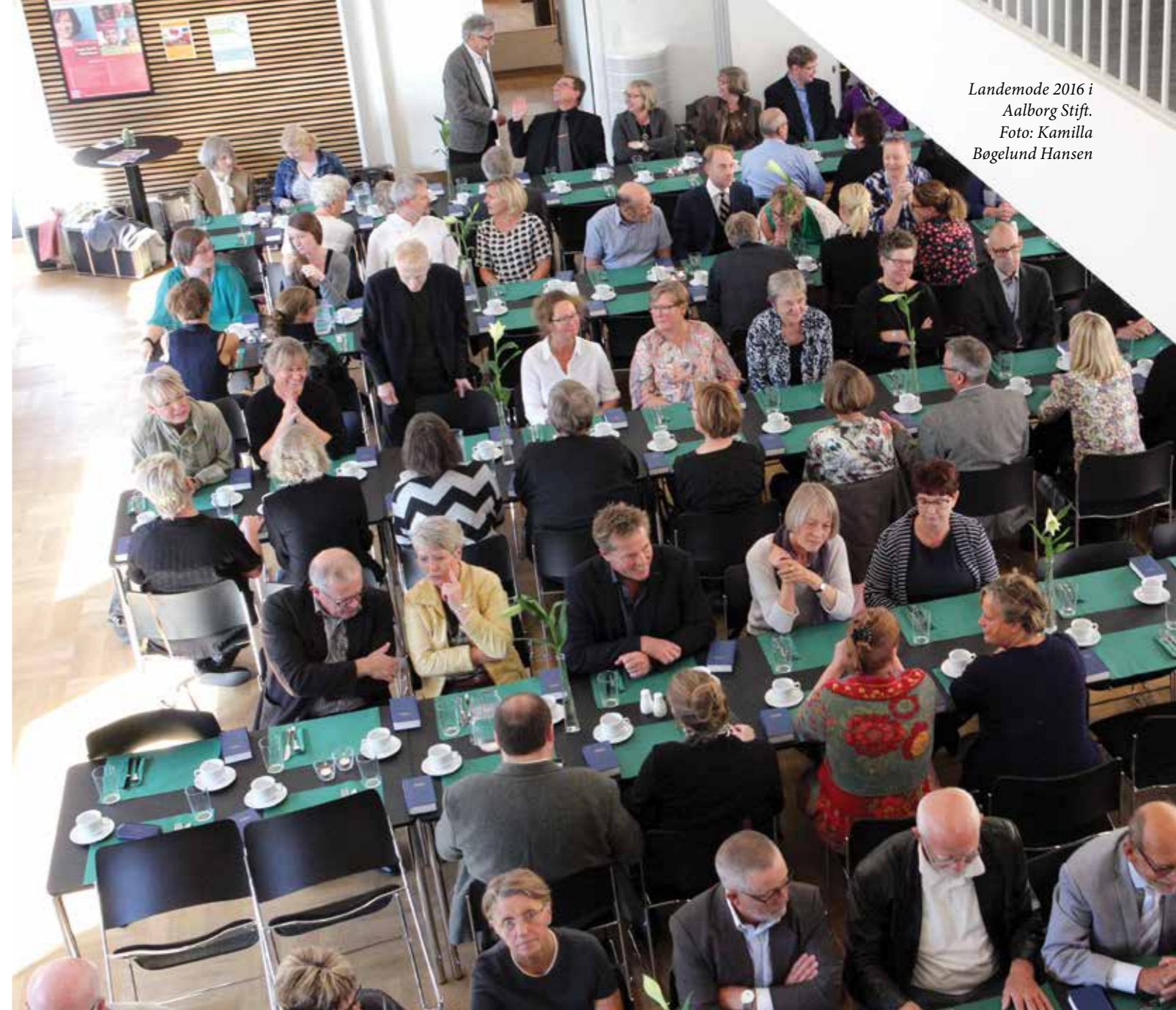
Landemode 2016 i Aalborg Stift.

Andre indsatsområder er babysalmesang, børnekorsarbejde, minikonfirmander og konfirmationsforberedelsen og jeg tør næsten ikke tænke på, hvordan dåbstallet havde set ud uden denne kæmpeindsats I udøver i sognene.