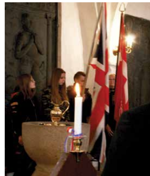
4. maj i Aarestrup Kirke,.

vældig spektakel i samtiden, alt imens han på samme tid sang folket sammen igen med sine lyriske digte om naturen, årstidernes skiften og