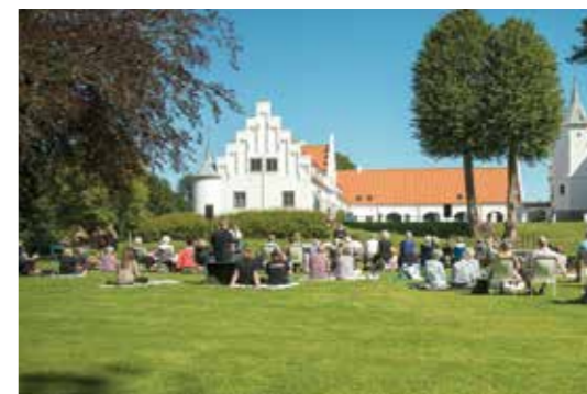
Lindenberg med slottet i baggrunden

- Besøg i kirken af de mindste klasser til en snak om Halloween og Allehelgen. Der blev snakket om død og begravelse og symboler på kirkegården, som vi til sidst gik på jagt efter.