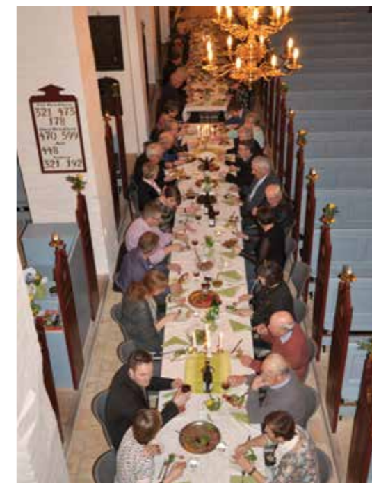
Skærtorsdag i Vrejlev Kirke.

Det betyder, at præsten kun er præst i funktionen. Så kun når nogen møder op til gudstjeneste, er præsten præst. Selvom at præsten står i sit mest funkklende ornat, så er præsten ikke præst, hvis ikke der er nogen andre. Således indsætter menigheden præsten hver gang de kalder. Ligeledes indsættes præsten ved at et forældrepar ringer og beder om dåb, og hvis nogle anmoder om begravelse. Det er menigheden, der indsætter præsten i funktionen, og gør præsten til præst. Præsten som funktion indsættes i embedet ved menighedens vedvarende kald og brug.