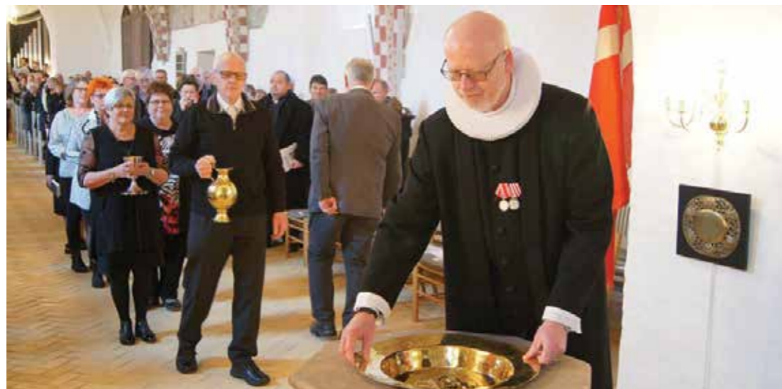
Genindvielse af Jetsmark Kirke. De hellige kar bæres ind.

Demokrati er en god ting – men ingen har sagt, at det er let! Nærdemokrati er rigtig godt, men jo nærmere, demokratiet kommer, desto