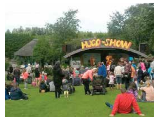
Hugoshow på Folkekirkens Feriehjælp i Jesperhus.

Folkekirkens Skoletjeneste i Brønderslev Kom-