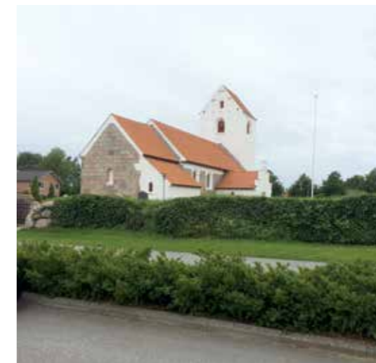
Farstrup kirke omgivet af grønt