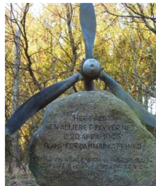
Flyverstenen i Rold Skov. Propellen fra den engelske maskine