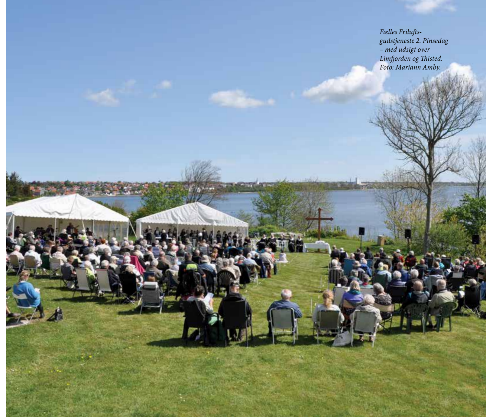
Fælles Friluftsgudstjeneste 2. Pinsedag – med udsigt over Limfjorden og Thisted.

provstesyn i Thorsted Kirke. Der er fire kirker i pastoratet. Thorsted sogn er et af de mindste sogne i pastoratet. Godt 200 folkekirkemedlemmer. Menigheden mødes til gudstjeneste en gang om måneden i Thorsted Kirke. Derudover inviterer menighedsrådet med jævne mellemrum til sang- og salmesangsaftener i kirken. Jeg har deltaget en enkelt gang en mørk efterårsaften. Der var stor