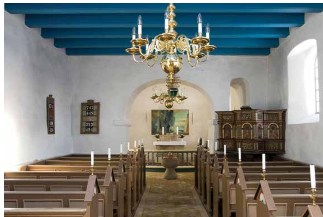
Stenum kirke skal bruges til mere end blot en enkelt gudstjeneste om måneden, mener menighedsrådet.

I Stenum Kirke er der i dag kun gudstjeneste hver fjerde søndag. Resten af tiden står kirken tom.