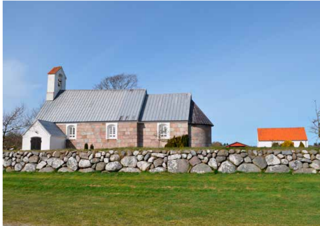
Thorsted Kirke.