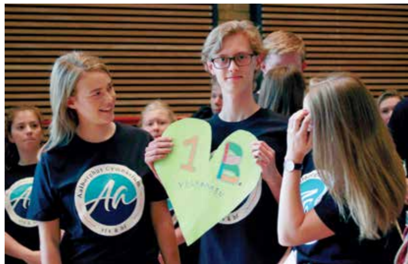
Elevtutorer tager imod på Aalborghus Gymnasium. Aug. 2016