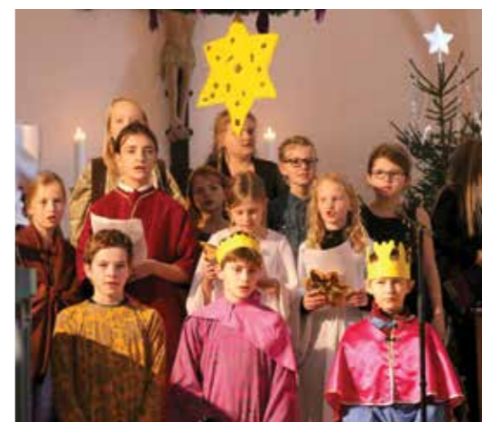
Musical i Blenstrup Kirke)