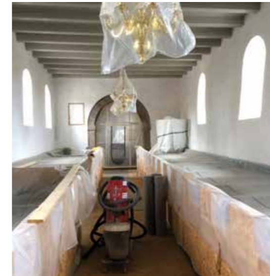
Farstrup kirke medvirker ved installering af nyt varme anlæg til at fremme miljøet

Som en videreførelse af provstiets bestræbelser på at optimere vore driftstiltag, har provstiet entreret med et konsulentfirma, der har som opgave