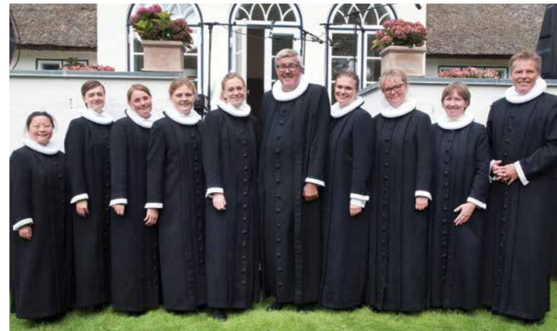
Alle præsterne i provstiet på nær en, som var syg, medvirkede i Gudstjenesten på provstidagen

Selvfølgelig skal skolen bidrage til begge dele, men noget af det, der har tegnet den danske skoletradition og gjort den både speciel og efterlignelsesværdig ude i verden og har været med til