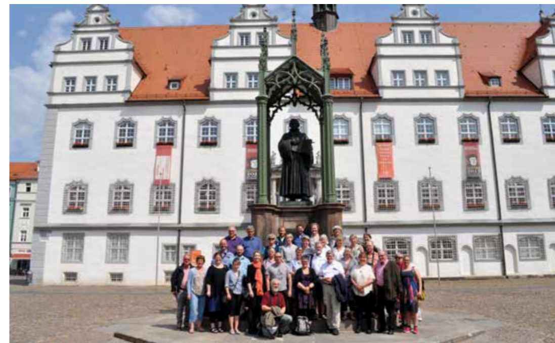
Studietur med præsterne i Sydthy, Thisted og Morsø provstier.

I maj 2016 deltog størstedelen af provstiets præster i en studietur til Lutherbyerne. Dette skete som en forberedelse til Reformationsjubilæet i 2017. Turen blev arrangeret af www.reformati-onsrejser.dk og blev afviklet i fællesskab med de to nabo-provstier Thisted og Sydthy. Både fagligt og socialt gav det et stort løft til præstekollegiet. Det var godt at få delt erfaringer og ideer på tværs af provstigrænser samtidig med, at vi fik fyldt godt på med teologiske og historiske data – og set de byer og steder, hvor Luther og hans kollegaer lærte, og reformationen havde sin rod.