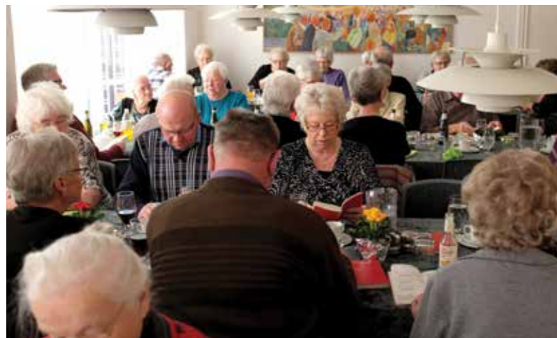
Spiseklub i Øster Assels.

Priser og tidsforbrug er vigtige elementer der har indflydelse på det færdige produkt. Hvis man vælger at tage de nye metoder i brug, skal man så informere kunderne først?