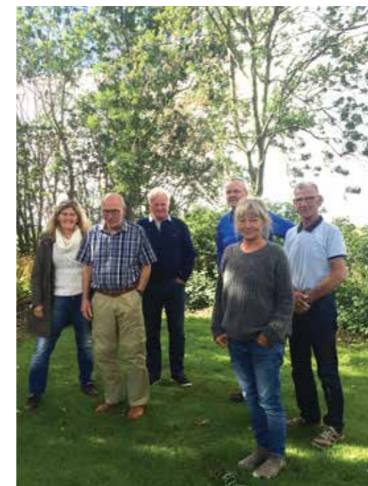
Kirkearbejdsgruppen fra "de syv sogne på Mors" har fået tilskud fra Folkekirkens udviklingsfond til at tænke nyt om kirkernes brug.

Stiftets Informationstjeneste har udarbejdet materiale med inspiration og konkrete værktøjer til arbejdet med frivillige. Men der kan også være