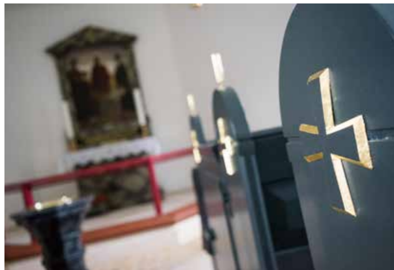
Detalje fra Hou Kirke