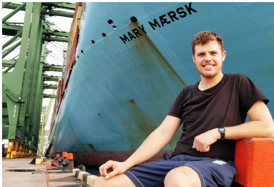
2022 | Fotos: Sille Arendt, Marie Øsérhol / Folkekirken.dk, Tine Harden og Anton Ba Skholm Fuelsen.

Der er pt. syv danske sømandskirker i store verdenshavne.