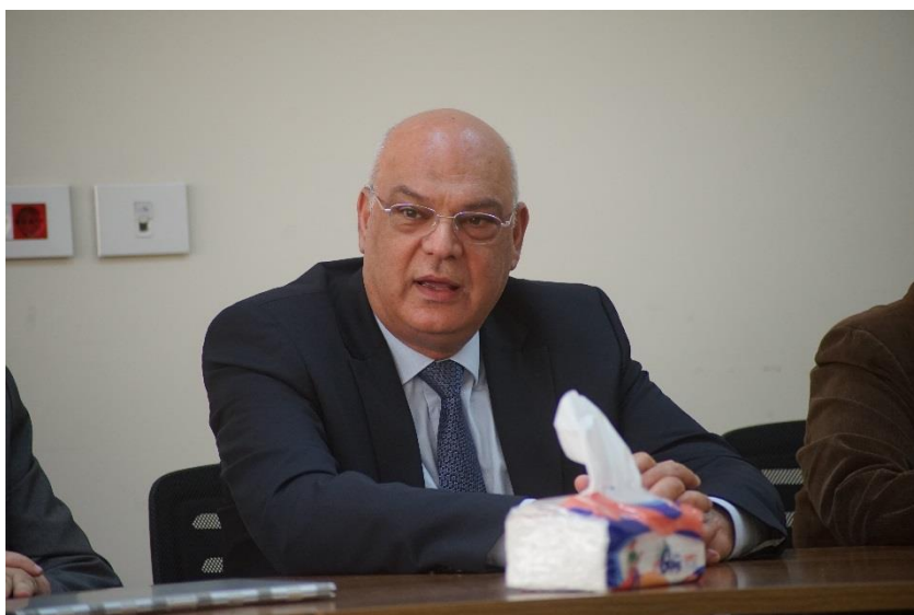
MP Bassem al Shaab.